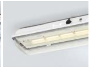
LED-Langfeldleuchte in der Lichtfarbe Gelb