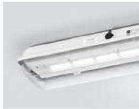
LED-Langfeldleuchte in der Lichtfarbe Neutralweiß (5.000 K)