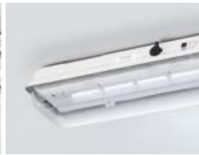
LED-Langfeldleuchte in der Lichtfarbe Kaltweiß (6.500 K)