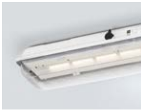
LED-Langfeldleuchte in der Lichtfarbe Warmweiß (4.000 K)